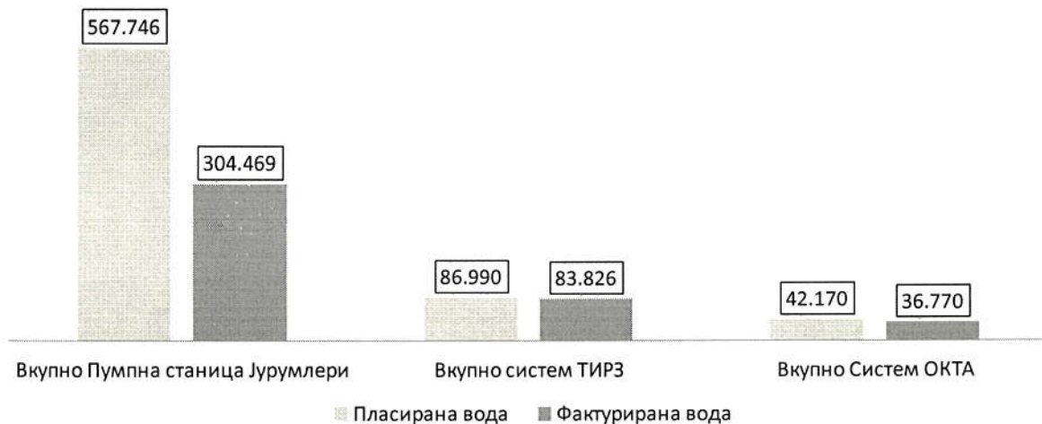
Табела 14: Пласирана и фактурирана вода (m 3 )